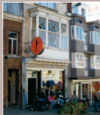
2 À ÉVITER AUSSI LE MACARON ORANGE