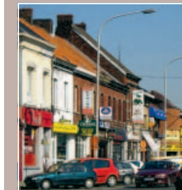
1 À ÉVITER SELON PÉRUWELZ

Mais le problème de ces chartes, c'est leur jeunesse: en pleine période de transition, les communes ont du mal à expliquer pourquoi, alors que certains commerces plus anciens ar-