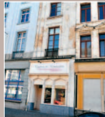
7 À ÉVITER L'ÉTAGE DÉGRADÉ