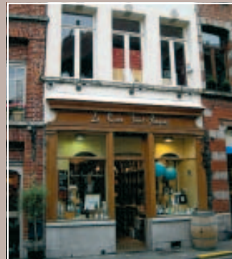
5 À PRÉSERVER L'ANCIENNE VITRINE