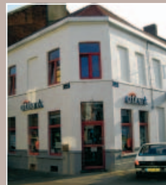
3 UN BON EXEMPLE LETTRES DÉCOUPÉES