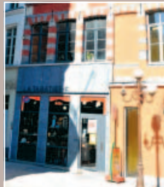
6 TOUTE RÉNOVÉE À TOURNAI