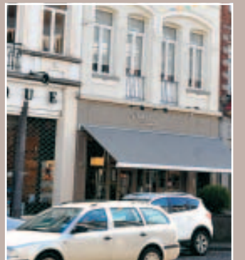
8 UN BEL EXEMPLE DANS LA RUE ROYALE